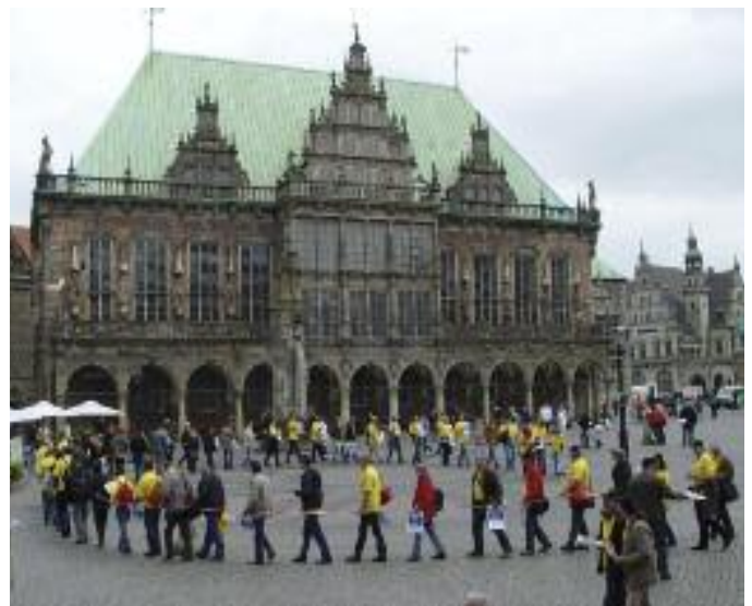
Aktion vor dem Bremer Rathaus

stadt haben bisher den größten Standort in Bremen besucht. Nun soll es eine „solidarische Retourkutsche“ geben. Was streiknormalerweise in Bremen stattfindet, geschieht nun in Hannover. Aber in Bremen gibt es ein weiteres Projekt. Streiktag ist Arbeitstag anderer Art. Also soll versucht werden, die Anlage eines Kindergartens zu renovieren. In der nahegelegenen Anlage muss einiges beackert werden. Die EDSler haben es sich vorgenommen. Streikdienst – für die Geschäftsleitungen ein Fremdwort.