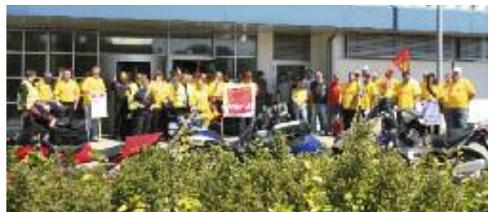
Ludwigsburger Streikende und Biker aus Rüsselsheim bei HP in Böblingen

schon so viel Verständnis und Unterstützung erfahren haben. Zentral ist darüber hinaus die Verständigung mit den Kolleginnen und Kollegen in dem 40 Kilometer entfernten Werk von HP in Böblingen. Die täglich erscheinende Streikzeitung wird hier verteilt und gut aufgenommen. Dem heutigen Streiktreffen schaut man schon freudig entgegen. Eins wünschen sich die Lud-