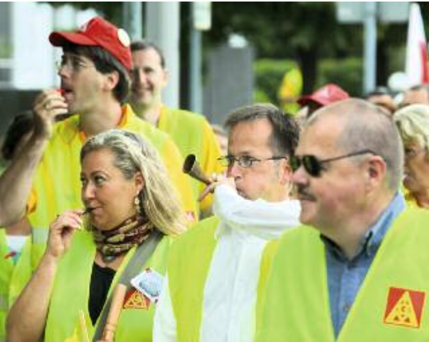
Lauter Protest in Rüsselsheim