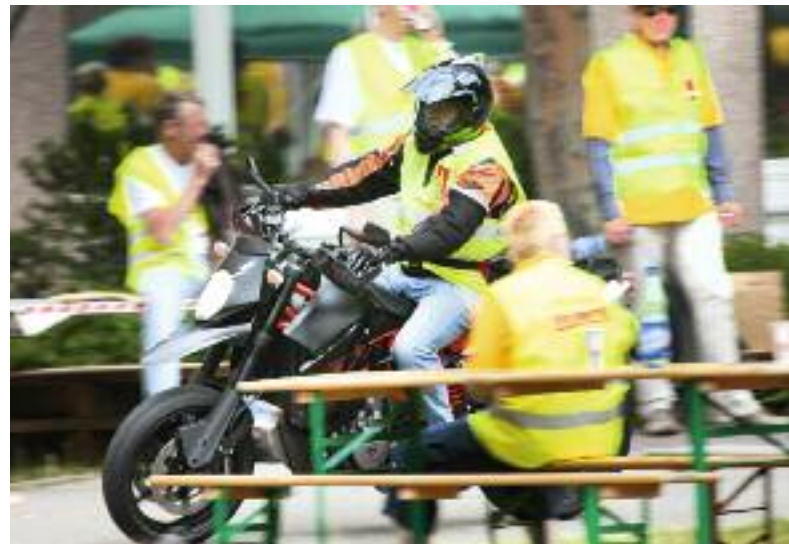
Immer dabei: Die Rüsselsheimer Motorradgang

Die Rüsselsheimer haben sich darüber genauso gefreut wie über die Solidaritätserklärung aus Bensheim: Kolleginnen und Kollegen von Sirona, früher Siemens Medizintechnik, waren da und haben sich mit den Streikenden solidarisch erklärt.